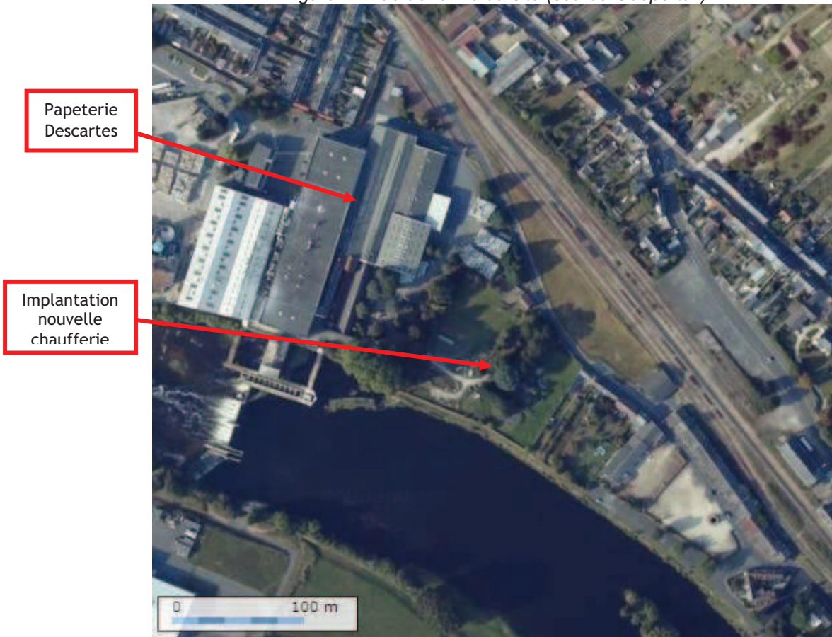
Figure 2 : Vue aérienne du site