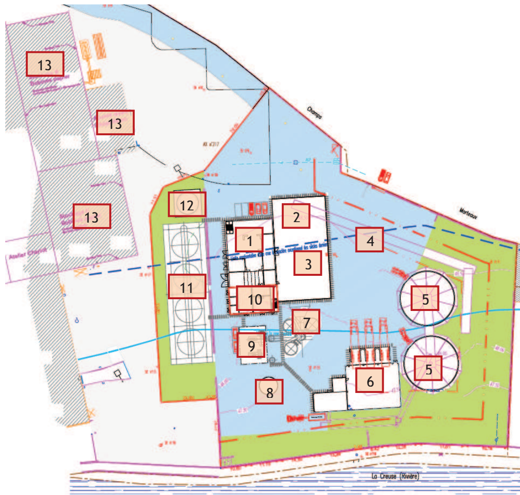
Figure 4 : Schéma de principe du projet