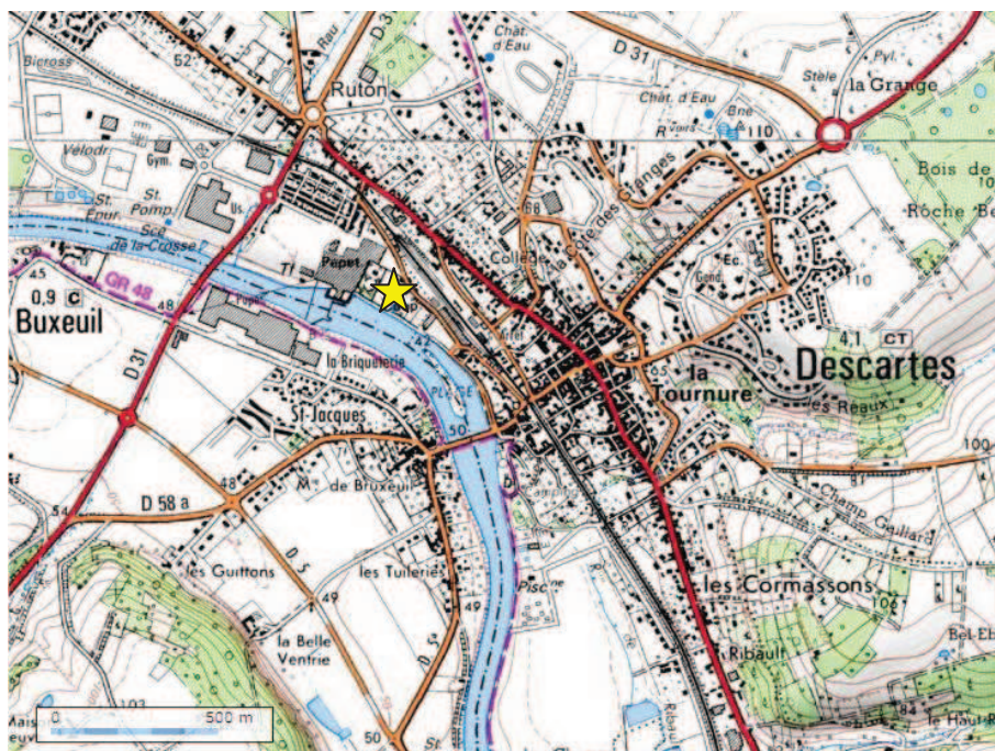
Figure 1 : Localisation du projet sur la commune de Descartes

Le projet est localisé sur le site actuel de la Papeterie SEYFERT sur la commune de Descartes (37160) , rue des Champs Marteaux . La parcelle concernée par le projet appartient actuellement à SEYFERT mais est en cours de cession à DALKIA France, retenu pour la construction de la chaufferie.