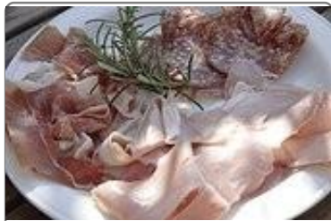
BOUCHERIE JEAN-LOUIS CHAUCHARD

2014 - 2016 © french-leader.com - All right reserved. - mettre à jour le rapport (mise_a_jour.php?siren=)