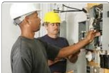
RIANI Eclairage Public